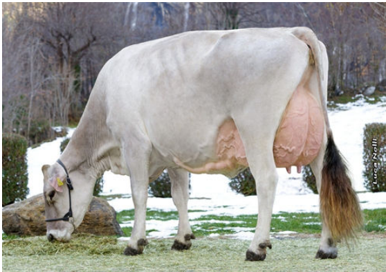
ADRIAN'S CALVIN ELANA DAM