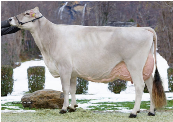
ADRIAN'S CALVIN ELANA DAM